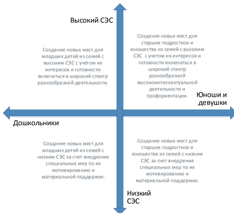
Рис. 5. Шкалы выбора модели создания новых мест по программам туристско-краеведческой направленности с учетом особенностей контингента обучающихся