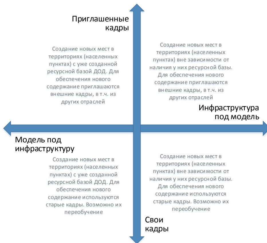
Рис. 6. Шкалы выбора модели инфраструктурного и кадрового обеспечения для типовой модели создания новых мест дополнительного образования

Следует отметить, что механизмы инфраструктурного и кадрового обеспечения не существуют в полярных вариантах. Решения даже в рамках реализации одной модели будут различными. Анализ перечисленных выше характеристик позволяет сделать эти точечные решения более точными и эффективными.