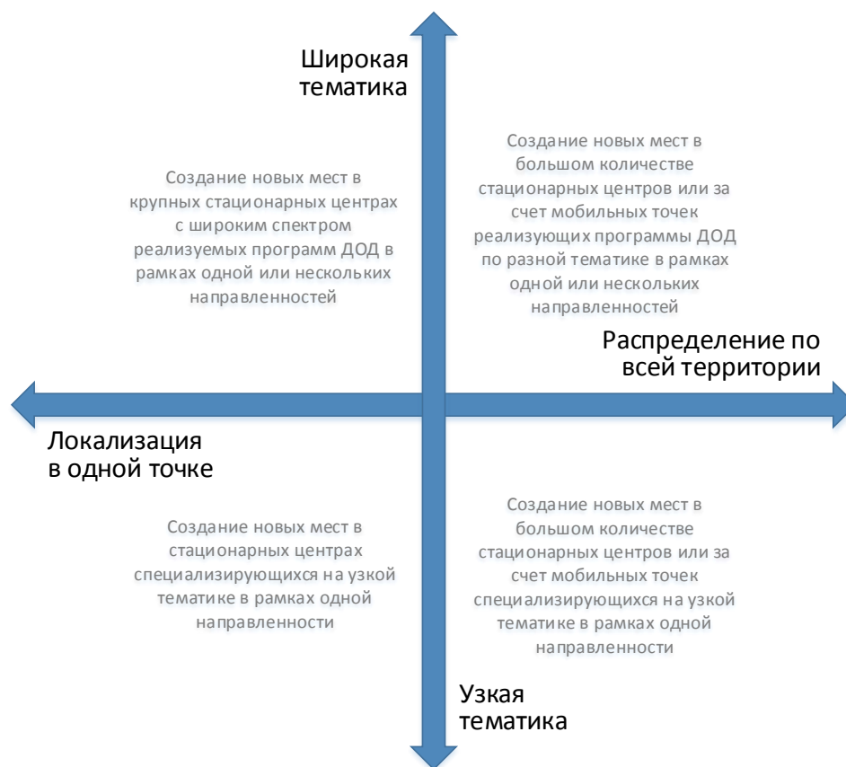
Рис. 3. Шкалы выбора масштаба и формы реализации новых мест по программам ДОД

При невыполнении хотя бы одного из них возникает необходимость пространственного распределения реализуемой модели через мобильные или сетевые решения.