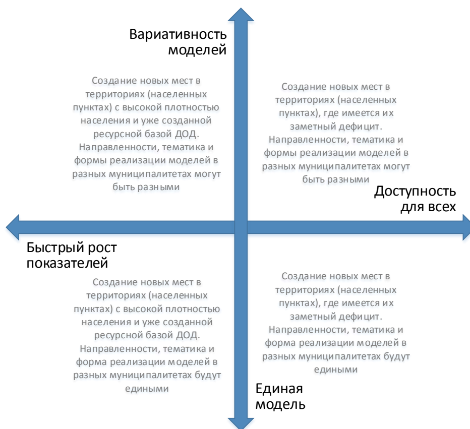
Рис. 4. Шкалы выбора модели создания новых мест с учетом актуальной управленческой политики

2) чем выше образовательный и культурный статус семьи (родителей), тем больше отдача от вкладываемых средств, особенно в части ресурсоемких и инновационных программ. Можно вложить значительные средства в создание высококлассных кружков по туризму в поселке с низким социокультурным статусом семей, но не получить востребованность у населения. Также можно целевым образом выделить сертификаты малообеспеченным семьям конкретно на эти кружки, но пришедших в них будет все равно крайне мало. Увеличение отдачи в этом случае потребует дополнительных вложений на проведение агитационных и рекламных мероприятий, эффективной информационной стратегии (рис. 4).