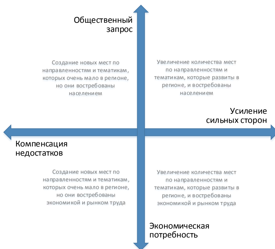
Рис. 2. Шкалы выбора тематики и тактики создания новых мест дополнительного образования

Итогом этого этапа выбора, построенного на основе самообследования и анализа полученных данных, станет определение приоритетного(ных) для региона образовательного(ных) направления (модулей) модели (рис. 2).